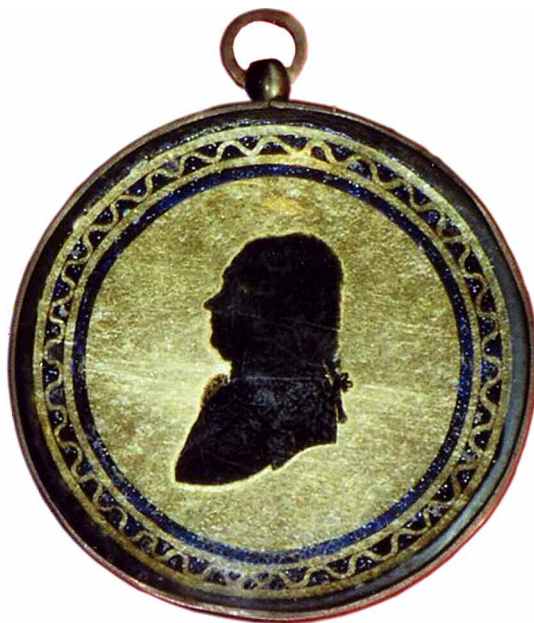
[3] Claus Gustav von Baranoff (1753–1814), estländskt lantråd, gift med Eleonora Gyllenstierna af Lundholm (1759–1799), dotter till Johan Gyllenstierna (1709–1764), silhuett av okänd konstnär.