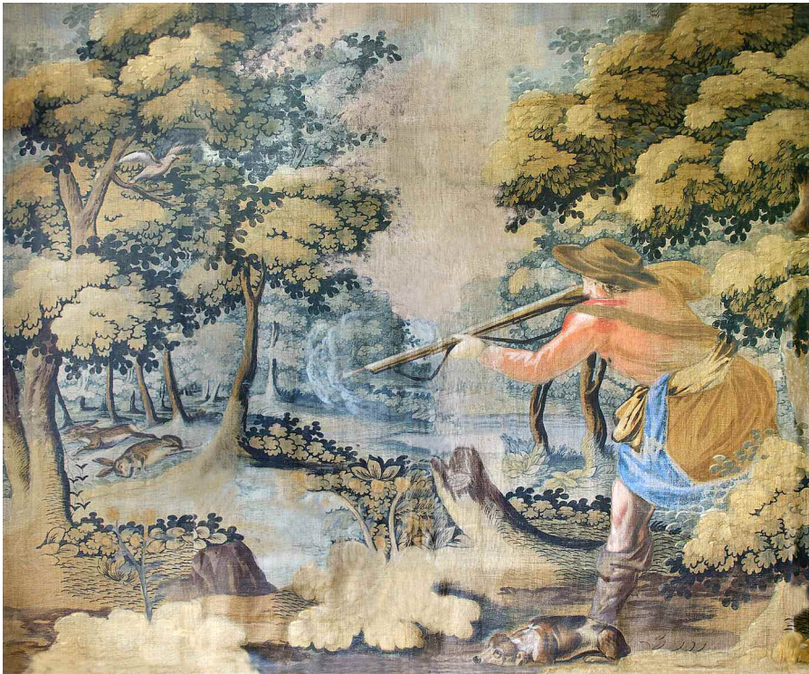
[12] Jakttapet från det Gyllenstiernska Björksund, Tystberga socken i Sörmland, från början av 1700-talet, målad på väv.